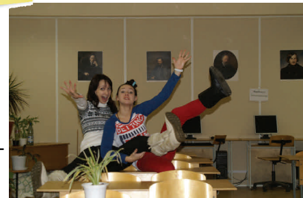
В библиотеке Ростовского-на-Дону филиала.